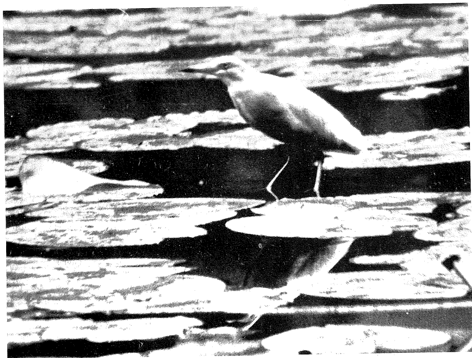
(1) Transmis à la Commission d'Homologation.

Le lendemain soir, nous le retrouvons perché sur son arbre. Avec d'autres ornithologues, nous l'observons longuement et le photographions. Il reprend sa pêche sur les nénuphars, puis, dérangé par notre présence, il s'envole vers un autre étang. Nous le redécouvrons rapidement près d'une berge à la végétation dense. Au vol, nous remarquons le cou replié en S, les pattes dépassant à peine les rectrices et les battements plus rapides que ceux du Héron cenaré ( Ardea cinerea ). Inquiet, il dresse verticalement le cou, le bec horizontal. Lorsqu'il pêche en marchant, il le tend en avant. Pendant toute l'observation, il n'émit qu'un cri rauque et grave.